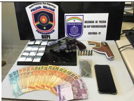
Operação “Força Amiga”