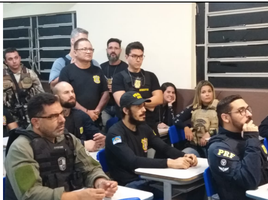
Operação “Força Amiga”